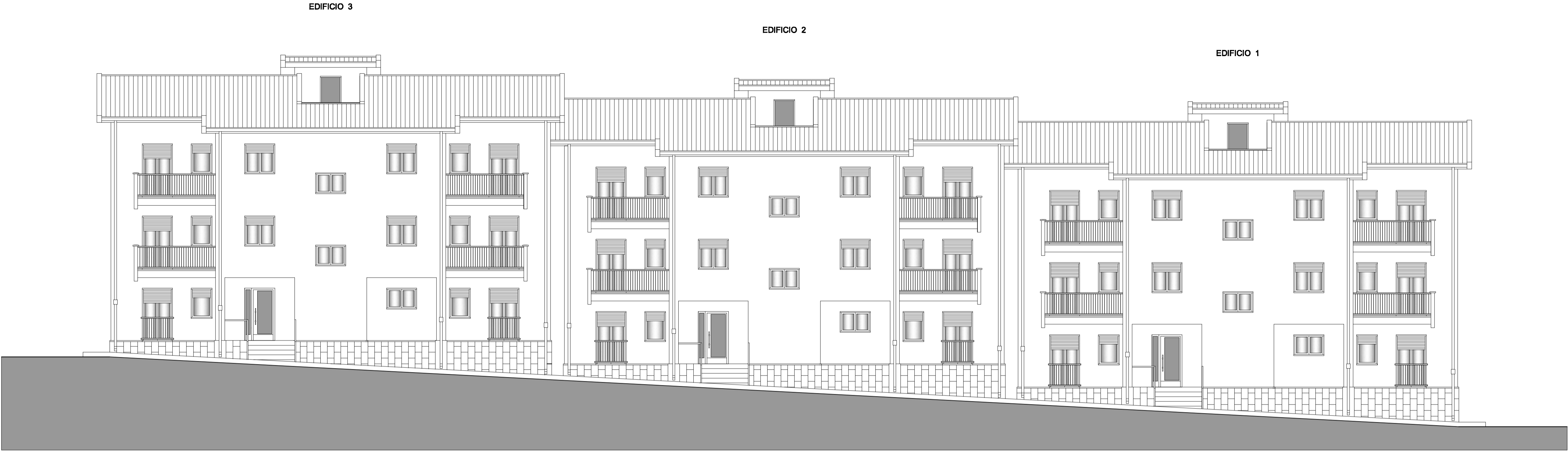
PROSPETTO PRINCIPALE ( verso gli ingressi )